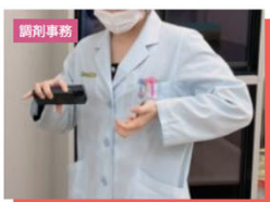
2023.06.23 先輩VOICE_ms20 先輩紹介 (医療事務)