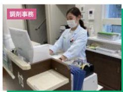
2023.05.08 先輩VOICE_ms15 先輩紹介 (医療事務)