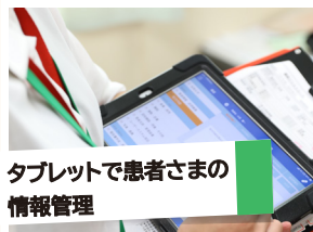
タブレットで患者さまの 情報管理