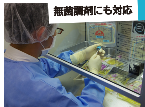
無菌調剤にも対応